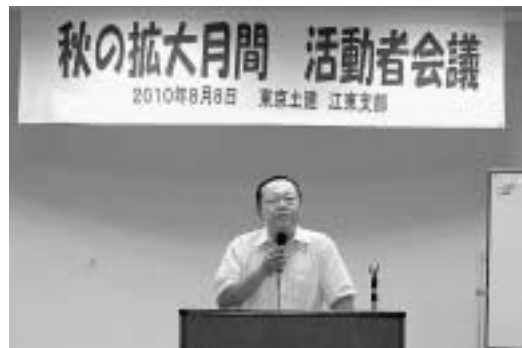
清水本部書記次長講演

8月8日(日)、支部会館 116人が集まり、支部活動者会議が開催され、松丸支部委員長、清水本部書記次長講演、鵜沢組織部長のあいさつ