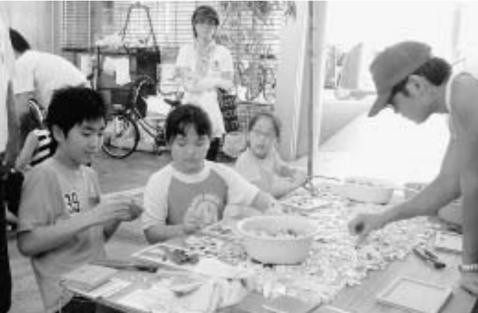
人気のタイルモザイクには子供たちの楽しい笑顔が

2面よりつづき て貰いました。通信病院、広島城、比治山と巡って来ました。 記念資料館を観覧して来ました。資料館では、色々な映像、写真、展示物を見学して来ました。 遺跡も凄かったのですがガイドさんの話が心に残っています。広島市の元の人達は後世に被爆の悲惨な実態を伝える為に色々な運動を行なっているとの事でした。遺跡の保存等も市民の皆さんの運動の成果だという事だそうです。 分科会が終わって、私達江東支部の3人は平和