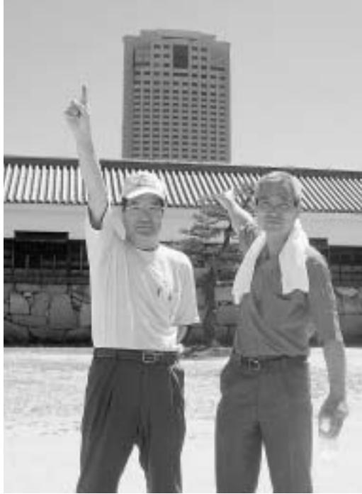
被爆国として核兵器の恐ろしさを世界に発信していきます

2面よりつづき て貰いました。通信病院、広島城、比治山と巡って来ました。 記念資料館を観覧して来ました。資料館では、色々な映像、写真、展示物を見学して来ました。 遺跡も凄かったのですがガイドさんの話が心に残っています。広島市の元の人達は後世に被爆の悲惨な実態を伝える為に色々な運動を行なっているとの事でした。遺跡の保存等も市民の皆さんの運動の成果だという事だそうです。 分科会が終わって、私達江東支部の3人は平和