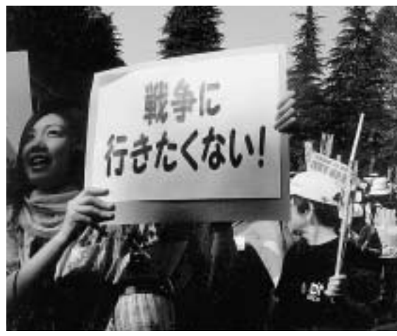
戦争反対を叫びつづけます

私は中学二年で三菱発動機工場に学徒動員、女学生は市電の車掌さんなど文字通り国家総動員でした。私の工場はゼロ戦のエンジン製造のため真先に爆撃を喰いました。ゼロ戦は米軍が最も恐れられた優秀な戦闘機でしたのでねらったのでしよう。同じく愛知時計は「飛燕」のエンジン製造で