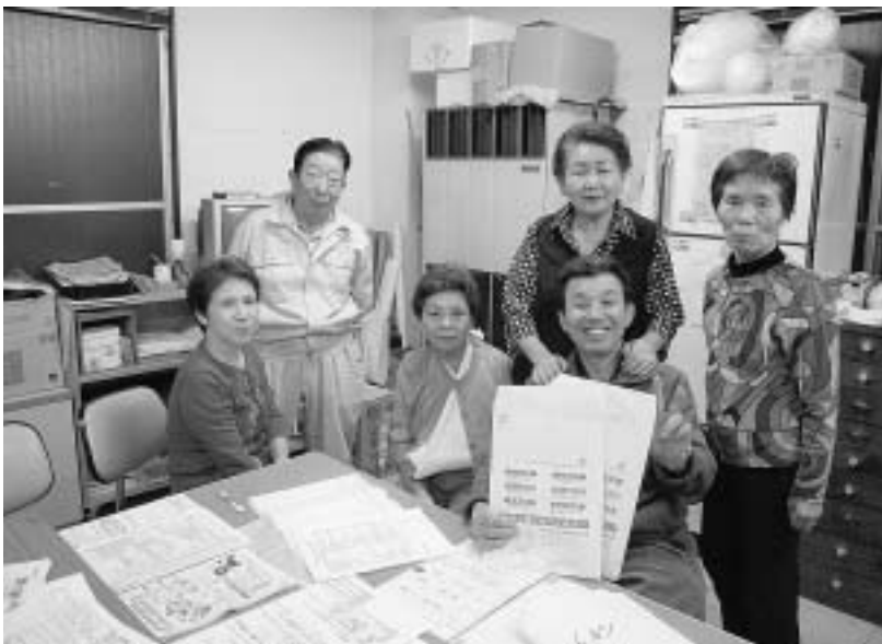
目標達成まであと一つ

喜楽会の協力を得て、再 加入対象者や家族従業員 などの「訴えやすく、可 能性の高い」対象へのア タックを実施しよう！