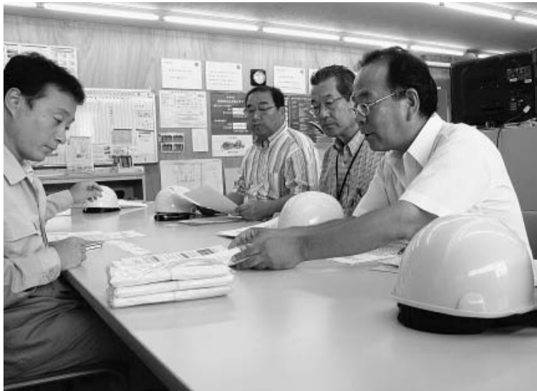
社保未加入問題について説明しました

秋の現場訪問行動は、定して訪問しました。江東区発注の公共工事八現場中心に事前に江東区営繕課から訪問の連絡を入れてもらい、時間を指し三現場、9月6日(木)は9人参加で四現場を訪問、建退共推進や現場安全、賃金などで懇談しました。 区役所からの連絡もあり、竹中工務店は初めて懇談にりましたが、第2亀戸中を請け負った東急建設は役所の連絡をも無視し懇談には応じませんでした。なを、確認書は当日一現場、郵送で、二現場から郵送で送られてきました。(賃金対策部)