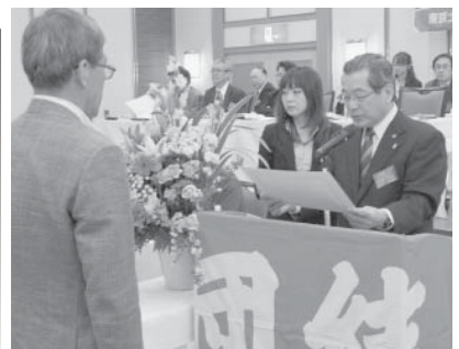
大会表彰される深川第3分会