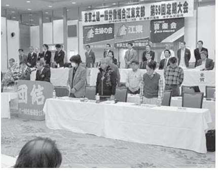
大会で選出された新役員