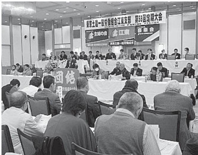
124人が熱心に討議した本会議