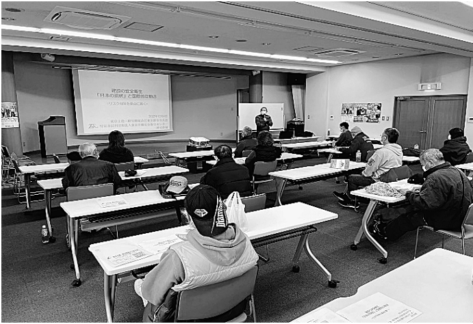
安全衛生講習です

12月4日(日)に労働 況、事故事例、海外での 対策部主催で普通救命講 習と安全衛生大会を開催 しました。2019年度 からコロナ禍で開催でき ず、3年ぶりの開催を待 ち望む声が多く、受講者 の皆さん熱心に講習に取 り組まれました。午前中 の普通救命講習では、い ざ救護が必要な方がいた 場合に「自分は何をすれ ばいいのか?」その疑問 たなきたい講習になりま す。2023年度も開催 予定ですので皆さんの ご参加お待ちしております。