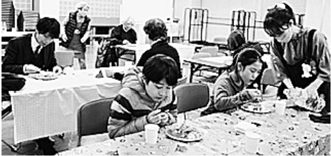
美味しく頂きました

12月16日(金17時)、 支部会館5階にて地域支 援活動の試験的な試みと して第1回子供食堂「金 曜日のカレー屋さん」を 開催しました。近隣の小 学生や小学校関係者、高 齢者、議員など参加者は