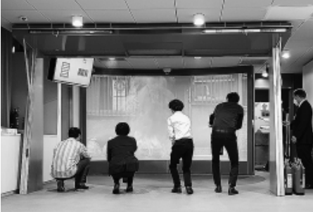
4人で腰を据えて消火!

最後「普段見ている のは、馴染みのない消火 器をちゃんと扱えるよう 教わりました。ピンホ ースローパーの順で、確 実な火元に向け消火でき るよう訓練、一番大変だ ったのは大きな声で「火 事だ!」と発声すること でした。このような場 力いっぱい発声 すること、い ざとなれば大声 も出せるかなど 思いました。 大切な家族を 守るためにも、 ぜひ機会があれば体験することを強くお勧めし ます。