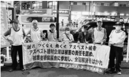
なくせ！アスベスト被害

【労働対策部より】 9月26日（金）東陽町 駅前にて、東京メーカ 訴訟第14回期日にあわせ た「被害者への賠償、ア スベスト被害の根絶を訴 える宣伝行動」をおこな い、9人が参加、チラシ とティッシュを配布しま した。 8月7日東京高 裁で1陣・2陣訴訟 において建材メ ーカーとの間で 和解が成立、初め て原告への「謝罪 を勝ち取りまし た。しかし、屋外 ・改修解体業者 に対する建材メー