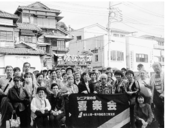
喜楽会はいつも元気に活動中

【大島・寺内 博】 秋の澄み切った空が、 どこまでも高く広がって ユシながら城ヶ島を散策 しました。 気持のいい好天に恵ま れた9月28日（日）、毎 年恒例の喜楽会日帰り旅 行が開催され、35人の仲 間が参加しました。 食事の後は長井海の手 公園ソレイユの丘へ。相 模湾、伊豆大島、富士山 などを眺望できる絶景、 季節ごとに変わる花畑、 動物とのふれあい、大型 アスレチックパークなど 誰もが遊び楽しみ尽くせ るエンターテインメント パ