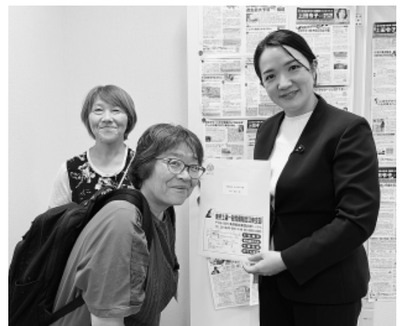
さんのへあや都議