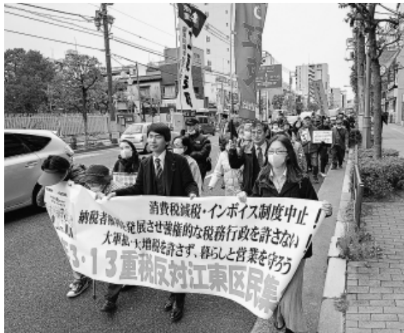
江東東税務署に向けデモ行進