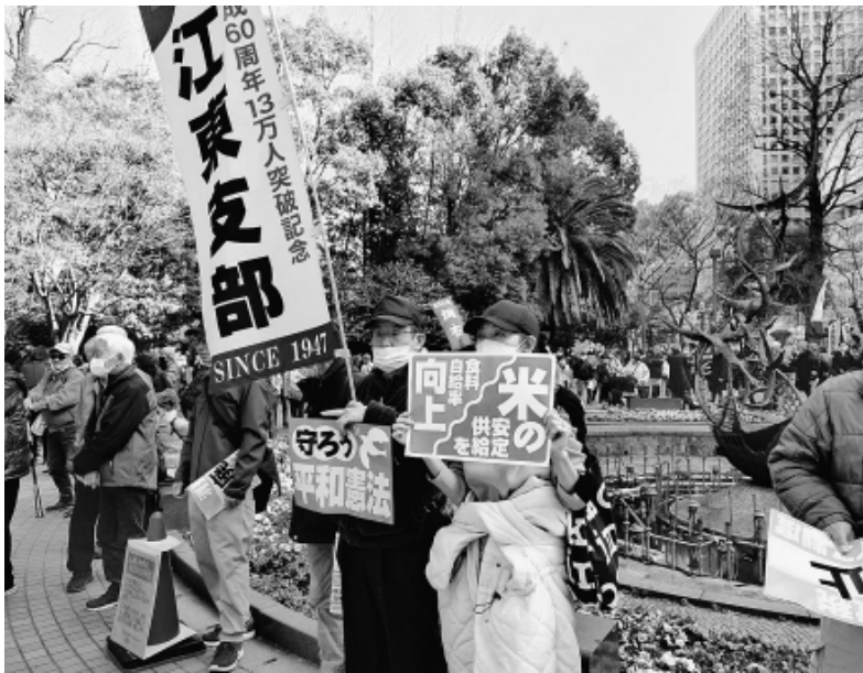
様々なくらし危機打開のためにアピール

3月5日(木)、建設業の改善と、様々な暮らし危機打開のために民間組合で立ち上げた、私たち東京土建も森組んでい る建設アクション実行委員会、国民春闘共闘委員会や全労連など5団体は「2026国民春闘勝利！3・6中央総決起集会」を日比谷公園かもめ広場