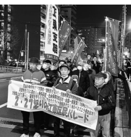
区民要求を横断幕に掲げアピール