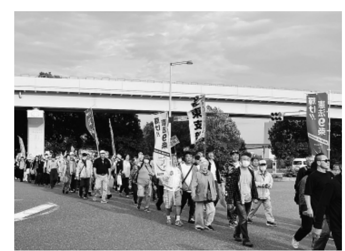
通過に2時間以上かかった長い隊列

5月3日の憲法記念日、東京・有明防災公園で開催された「5・3憲法大集会」に、労働組合、市民団体、学者・文化人、青年・学生、子育て世代など、さまざまな団体・個人あわせて約5万人が参加しました。江東支部からも17人が参加し、憲法改悪を許さず、平和とくらしを守る決意を新たにしました。