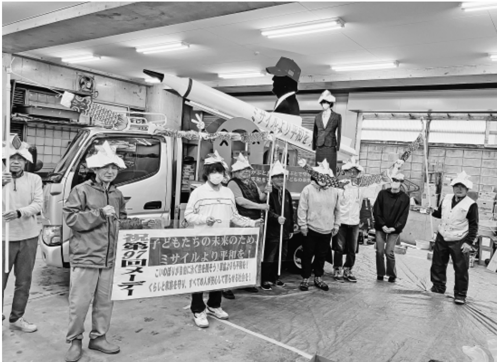
あいにくの雨でしたが優秀賞を受賞しました