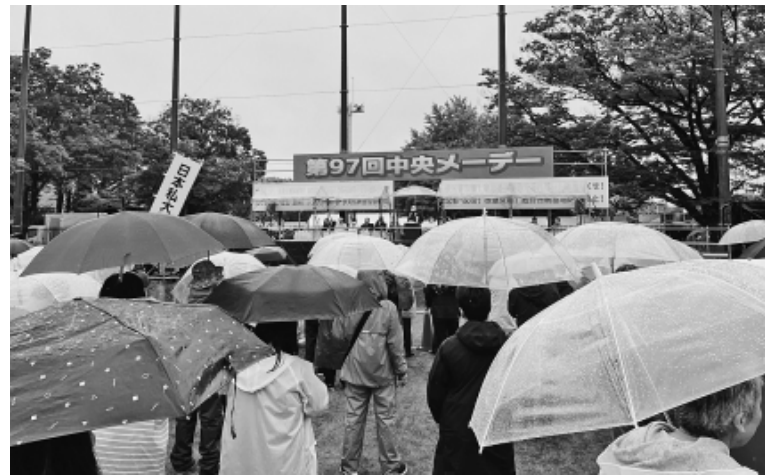
水たまりを避けながら式典に参加する仲間

第97中央メーデーは代々木公園に8千人、江東支部からは53人の仲間が参加し、「働くものの団結で生活と権利を守り、平和と民主主義、中立の日本を目指そう」のスローガンを掲げて開催。パレード(デモ行進)は悪天候のため中止となり、式典のみの開催となりました。