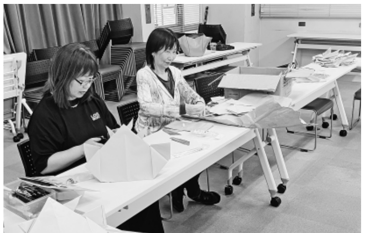
メーデー実行委員のかぶと作り