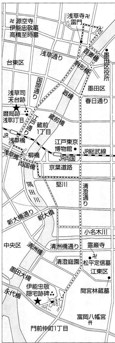
忠敬歩測練習の道筋

めに、冬を気にしながら津軽半島の三厩まで一日40キロも歩測しながら進んだ。函館までの70キロ、などからどうしても翌年風待ちで8日間費やした。結局蝦夷測量は全部行徳から始めて奥州東海岸を経て蝦夷に渡った。2次の際は測量マニユアルも整備し、各段と無駄が減り、精度が上がった。忠敬にとっては不十分な第1次であったが、幕閣は高く評価し、第2次の計画に進んだのである。(前号の第1次出立日9日を19日に訂正します。引用渡辺一郎著「伊能忠敬測量隊」から一部)